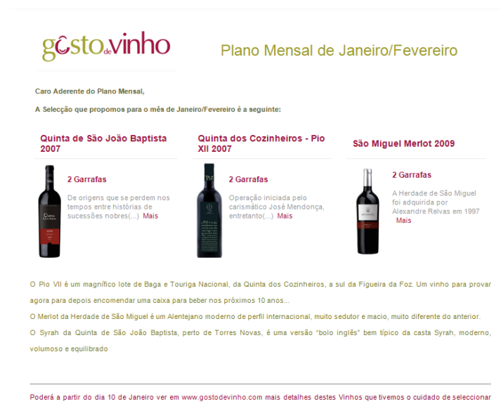
Fig.13 Exemplo de Newsletter