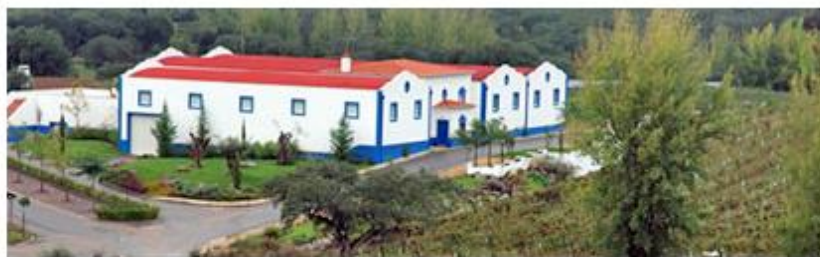
Imagem Homepage →

O resultado do agrupamento dos itens será o seguinte: